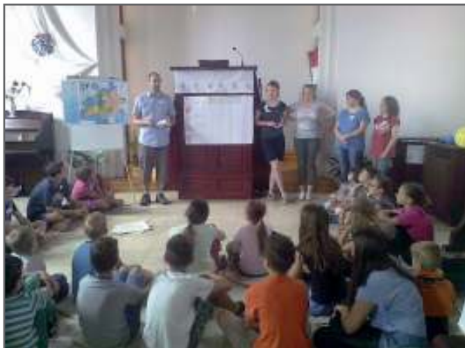
Idén másodszor rendeztük meg a nyári angol hetet

az idei esztendőben nem változott az egyházfenntartói járulék összege, az továbbra is személyenként 10.000 forint egy évre. Ha ezt elosztjuk tizenkettővel, azaz a hónapok számával, nincs egészen ezer forint havonta. Ha csak ennyit visszaadna mindenki abból, amit Istentől kapott, nem kellene nagyon sokszor azon gondolkodnunk, hogy működőképes marad-e a gyülekezet a következő hónapokban.