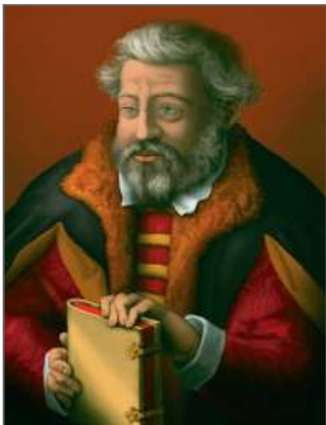
Szegedi Kis István református teológus (1505-1572)