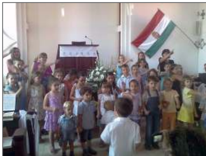
2015-ben is volt nyári ovis tábor a gyülekezetben

lálkozunk az adventi vasárnapokon az Európa téri rendezvényeken és az istentiszteleteken!