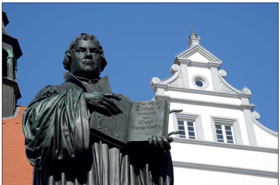
Luther Márton szobra Wittenbergben